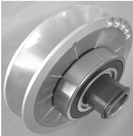
Poulie avec ROULEMENT d'un seul côté

Ces poulies permettent d'obtenir des performances d'entrainement supérieures au niveau rentabilité et durée de vie. Elle se distingue par sa douille à profil polygonal empêchant tout coincement du flasque mobile.