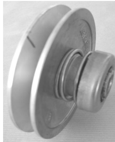
Poulie avec RESSORT d'un seul côté